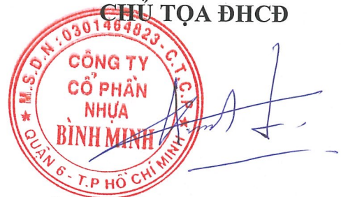
Sakchai Patiparnpreechavud Chủ tịch HĐQT